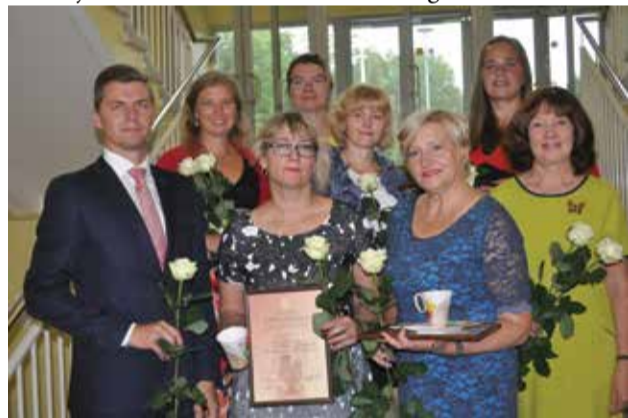
Õpetajate maakondlikul augustifoorumil tunnustatud Kanepi Gümnaasiumi õpetajad ja Kanepi vallavanem.