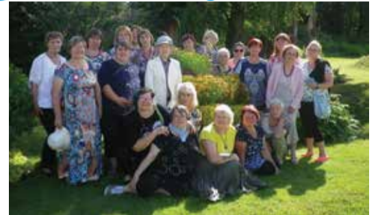
Käsitööring külas Nõrga talus Viljandimaal.

Vöhma Valgusevabrikus ootas meid saabudes giid, kes väga humoorikalt andis väikese ülevaate vabriku ajaloo ning käsitööküünalde ja -kaartide valmistamise protsessist. Et ekskursioon oleks ka praktilist laadi, võtsime osa töötoast, kus iga huviline valmistas endale kaasa võtmiseks küünla. Olustvere mõisa ekskursioon algas mõisa keraamikakojast, mille töötoas valmisid kaunid rahvamustris savist nõõbid või kaelaehed. Seejärel toimus ringkäik giidiga, kes tutvustas mõisa-kompleksi ja rääkis selle ajaloo. Lei-