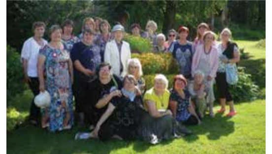
Käsitööring külas Nõrga talus Viljandimaal.

Vöhma Valgusevabrikus ootas meid saabudes giid, kes väga humoorikalt andis väikese ülevaate vabriku ajaloo ning käsitööküünalde ja -kaartide valmistamise protsessist. Et ekskursioon oleks ka praktilist laadi, võtsime osa töötoast, kus iga huviline valmistas endale kaasa võtmiseks küünla. Olustvere mõisa ekskursioon algas mõisa keraamikakojast, mille töötoas valmisid kaunid rahvamustris savist nõõbid või kaelaehet. Seejärel toimus ringkäik giidiga, kes tutvustas mõisakompleksi ja rääkis selle ajaloo. Lei-