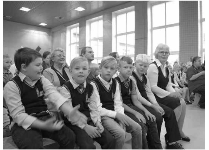
1.septembri aktusel.

Gümnaasiumi lõpetajad sooritasid 3 riigieksamit, ühe koolieksami ning 2015/16 õppeaastal kaitsesid kõik väga edukalt oma uurimistöid. Kõige paremad tulemused olid gümnasistidel inglise keeles, kus kõik lõpetajad saavutasid B2 keeletaseme, sest nende eksami eest saadud punktid olid 75 punkti ja üle selle. Inglise keele eksam on kaheosaline: kirjalik ja suuline. Mõlema testiosa keskmised olid kõrgemad vabariigi keskmisest. Kirjaliku testiosa punktid olid 7,1 punkti võrra kõrgemad vabariigi keskmisest. Suulise eksami eest on maksimaalselt võimalik saada 20 punkti. Meie õpilaste keskmine punktisumma oli 19 punkti ehk siis 95% maksimaalsest tulemusest. See oli väga tubli tulemus ja 3,3 punkti võrra kõrgem vabariigi keskmisest. Eesti keele eksami tulemused jäid vabariigi keskmisele tasemele. Matemaatika riigieksam nii hästi ei läinud, kuid kolme eksami kokkuvõttes saavutasid lõpetanud head tulemusi. Koolieksamiks valisid gümnasistid keemiat, ühiskonnaõpe-