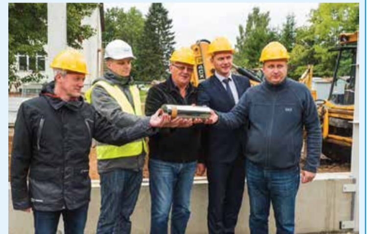
Kanepi katlamajale nurgakivi panek.

4. septembril asetati Kanepi aleviku katlamajale nurgakivi. Lehe ilmumise ajaks peaksid tööd olema lõppjärgus, et juba algaval kütteperioodil kütta Kanepi koolimaja, Kooli 1a kortermaja, vallamaja ja Kanepi lasteaia hoonet uuest katlamajast tulevaga. Katlamaja ehituslik maksumus oli 270 000 eurot. Sellest 50% maksab soojatootja SW Energia ja teise 50% Keskkonna Investeeringute Keskus (KIK). Soojatransside hind koos vajalike liitumissõlmedega oli 100 000 eurot. Sellest 50% maksab Kanepi vald ja ülejäänud 50% KIK.