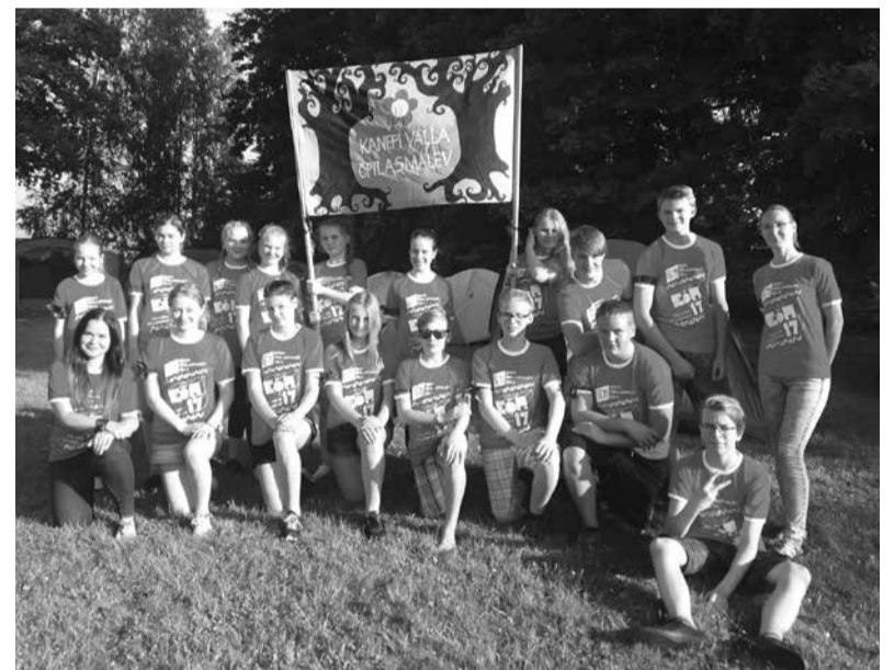
PÕM kokkutulekul Kiisal.