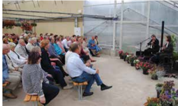
Kontsert Kanepi Aiandis.