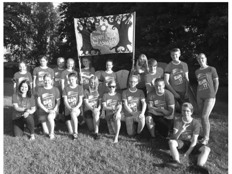
PÕM kokkutulekul Kiisal.