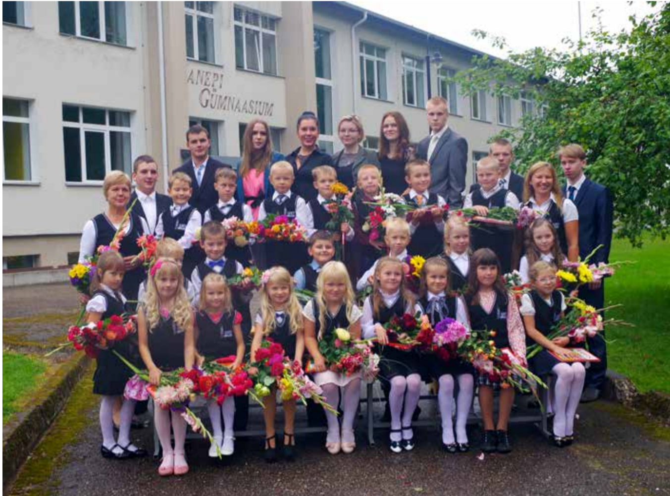
1. ja 12.klass esimesel septembril. Kanepi Gümnaasiumis algas uus õppe-aasta: esimesse klassi astus 22 õpilast, 10.klassi 15 õpilast, kokku õpib koolis 174 õpilast. Kanepi kooli asus tööle 4 uut õpetajat: gümnaasiumi matemaatikaõpetaja, haridustehnoloog -informaatikaõpetaja, eesti keele õpetaja ja klassiõpetaja.