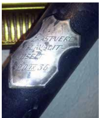
Erastvere Perenaisteseltsi lipuvardas hõbedase tunnustusplaadiga 1936. a.

Avatud talude kohvikute päeval pöördus minu poole noor mees, kes järgnenud kokkusaamisele tuli uhke musta lipuvardaga, mis oli kuulunud Erastvere Perenaisteseltsile, mida kinnitas ka hõbedane tunnustusplaat Erastvere Vallavalitsuselt 20.09.1936. aastast. Kaks hõbenaela olid löödud lipuvardasse ilmselt lipu pühitsemisel. Lipuvarda üleandja oli Kullo-Peep Kongo Mäe-Jakabi talust vanast Erastvere