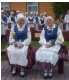
Hele-Mall Tärna ja Laine Laan.

Edasi suundus rongkäik keskalevisse. Rongkäigu ees veeres ajalooõnguline hobu-