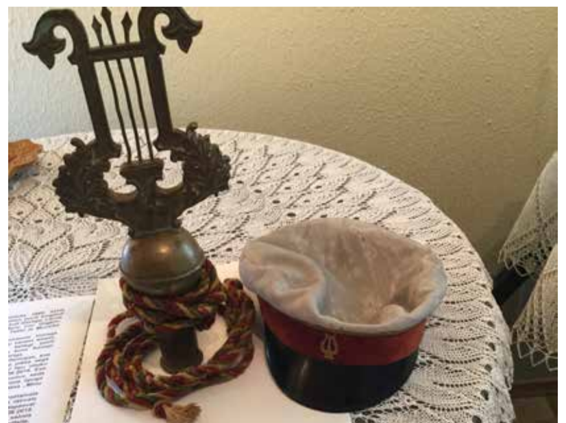
Lipuotsiku lüüra koos Leili Sarapuu isa segakoori mütsiga (1937. a.).