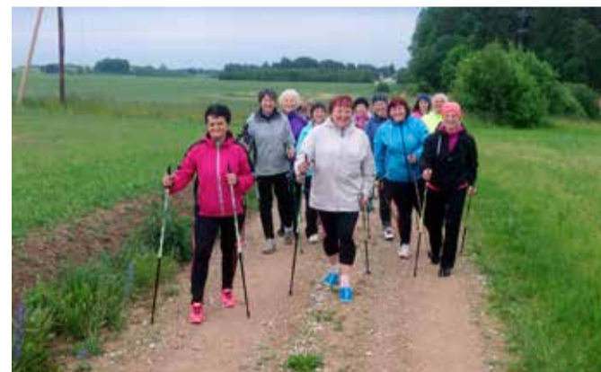
Kihelkonna kõnnisarja III etapp Kõllestes.