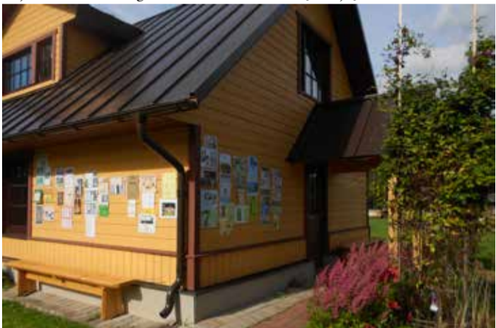
Savi talus on kõik sündmused jäädvustatud.