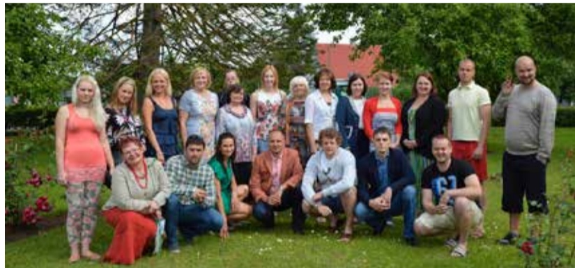
10 aastat lõpetamisest.