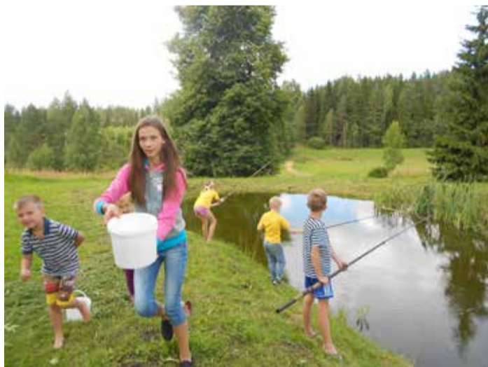
Mesipuu talus.

Bullerby hõnguga Mesipuu talu ootas huvilisi Jõgeharal, kus naerukurdudega vanaema Maie ja vanaisa Henu andsid talu valitsemisele päeval üle lastelastele. Külalisi võtsid vastu Mesipuu talu lapsed, kes tutvustasid oma töid ja tegemisi. Näidati ette peenramaa, toideti loomi, püüti kala, parvetati. Jäätisekohvikust sai omavalmistatud jäätist.