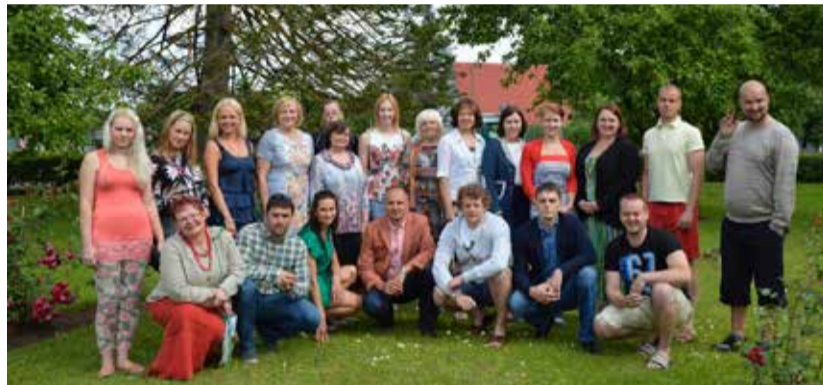
10 aastat lõpetamisest.