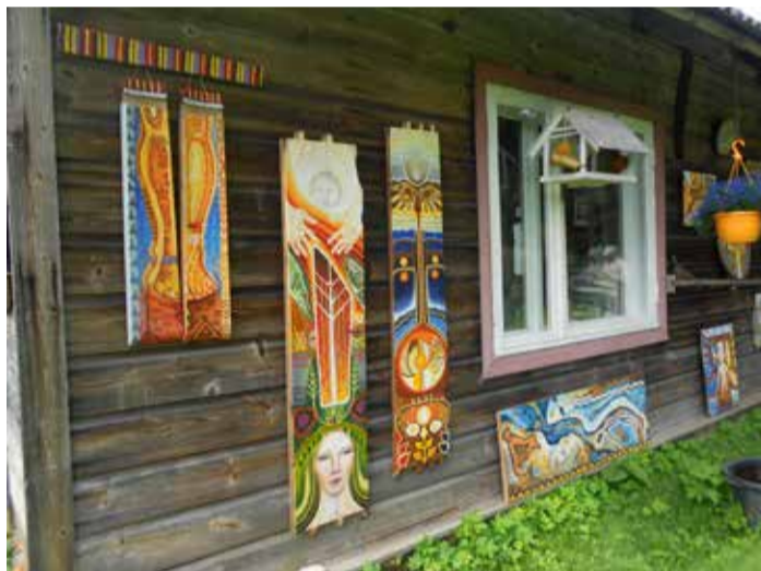
Kunstnik Epp Margna töö.

Bullerby hõnguga Mesipuu talu ootas huvilisi Jõgeharal, kus naerukurdudega vanaema Maie ja vanaisa Henu andsid talu valitsemisele päeval üle lastelastele. Külalisi võtsid vastu Mesipuu talu lapsed, kes tutvustasid oma töid ja tegemisi. Näidati ette peenramaa, toideti loomi, püüti kala, parvetati. Jäätisekohvikust sai omavalmistatud jäätist.