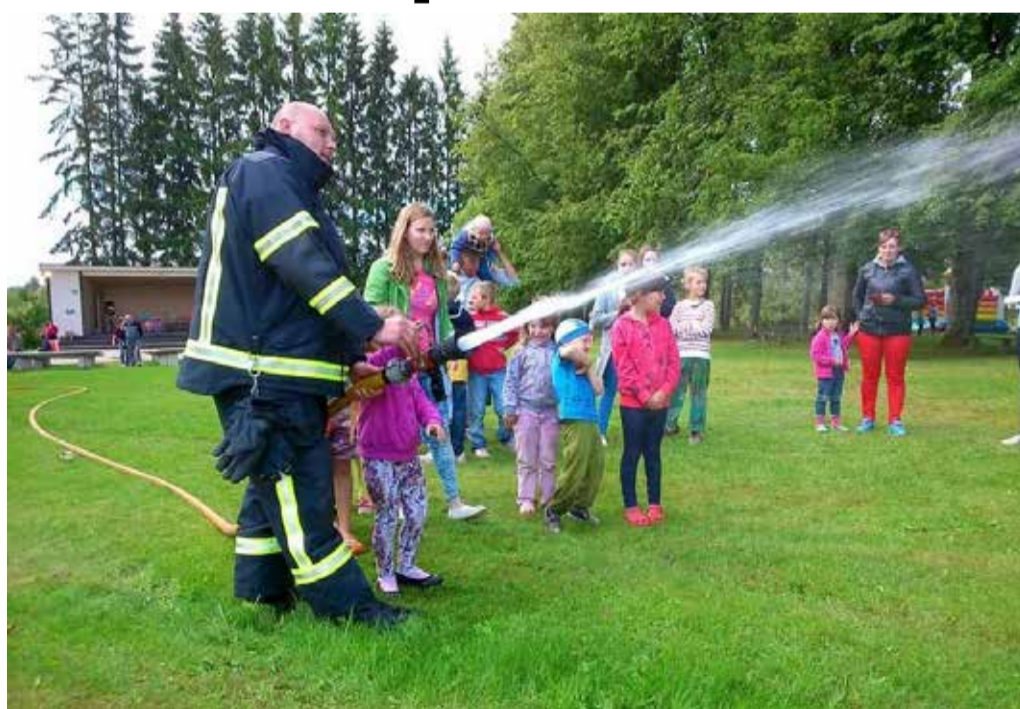
Põlgaste Küla Kodukandipäev.

Seejärel oli aeg aktiivsetel täiskasvanutel ennast proovile panna. Toimusid lõbusad mängud ja võistlused. Tublid osavõtjad said ka autasustatud.