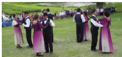
Tantsurühm „Päripidi” esinemas. (järgneb lk 2)