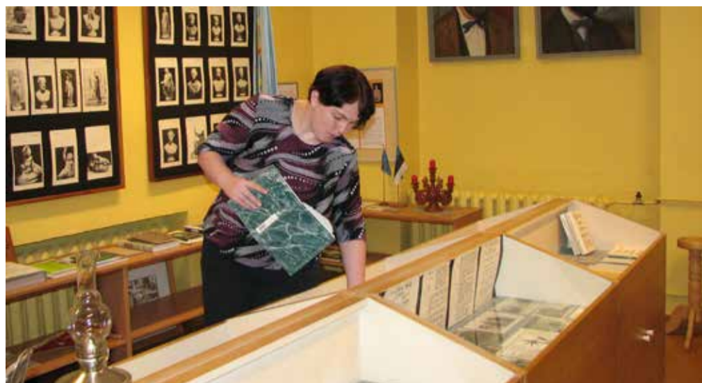
Kanepi Gümnaasiumi muuseumituba ootas ajaloo huvilisi.