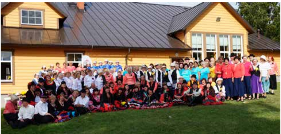
Seeniortantsupeol „Tants teeb südame rõõmsaks” osales ligi 150 tantsijat.