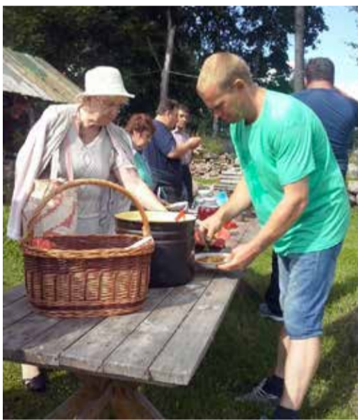
Kooraste mõisas võõrustati külalisi kahel päeval.

Kooraste mõisas sai näha kalkuneid, parte, hanesid, kanu, nutriaide, jäneseid, lambaid ja kitsi. Urmas ja Kristel Ki- virand jagasid lahkelt seletusi.