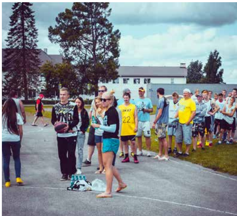
Streetball 2015 viskevõistlus.