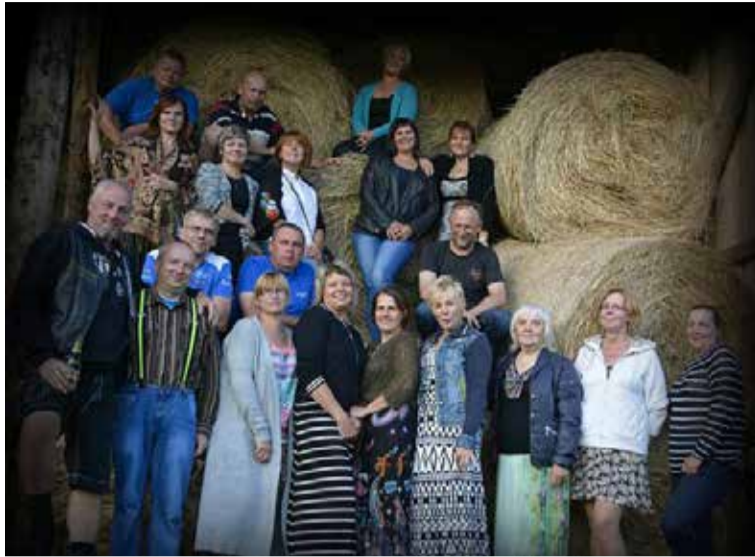
30 aastat lõpetamisest.