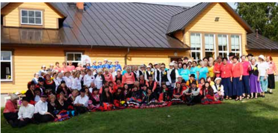
Seeniortantsupeol „Tants teeb südame rõõmsaks” osales ligi 150 tantsijat.