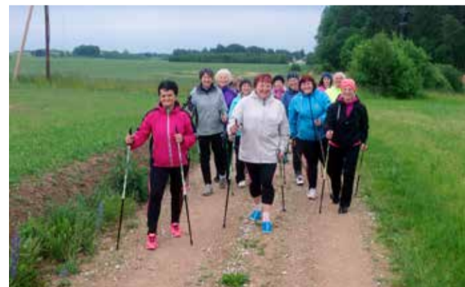
Kihelkonna kõnnisarja III etapp Kõllestes.