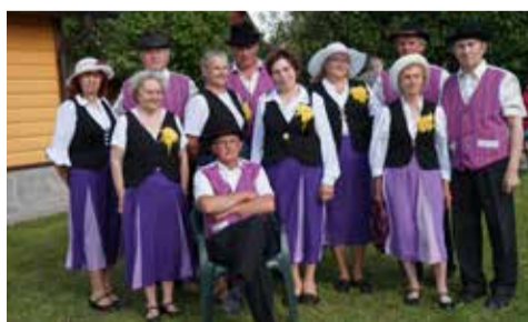
Tantsurühm „Waltzer”.