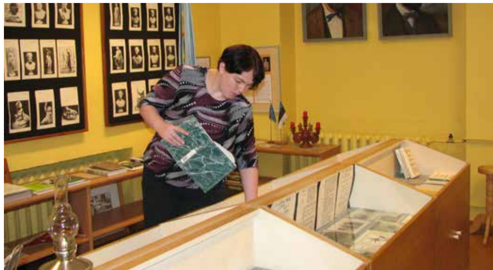
Kanepi Gümnaasiumi muuseumituba ootas ajaloo huvilisi.