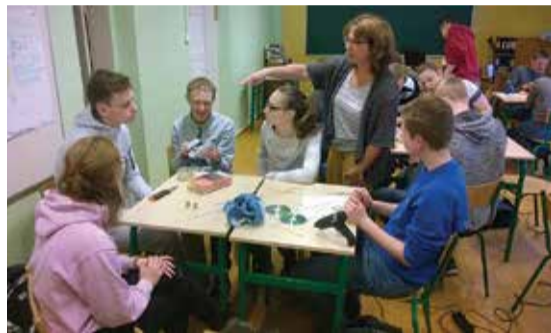
Autode ehitamine füüsikatunnis.