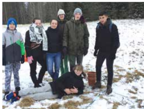
Seiklusmäng Erastvere metsas.