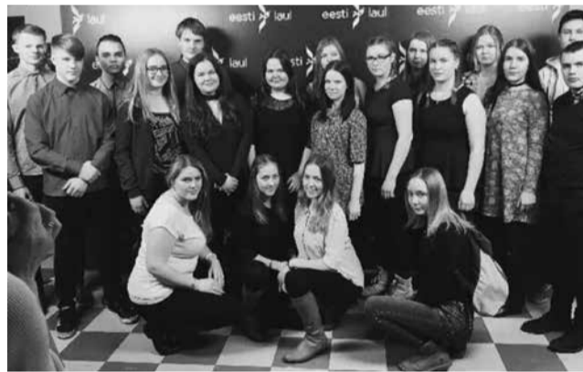
Eesti laulu salvestusel ETV majas.