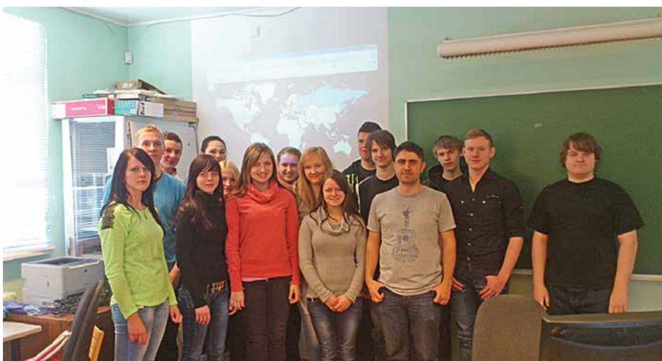
10.klass koosTürgi üliõpilasega pärast arvutitundi