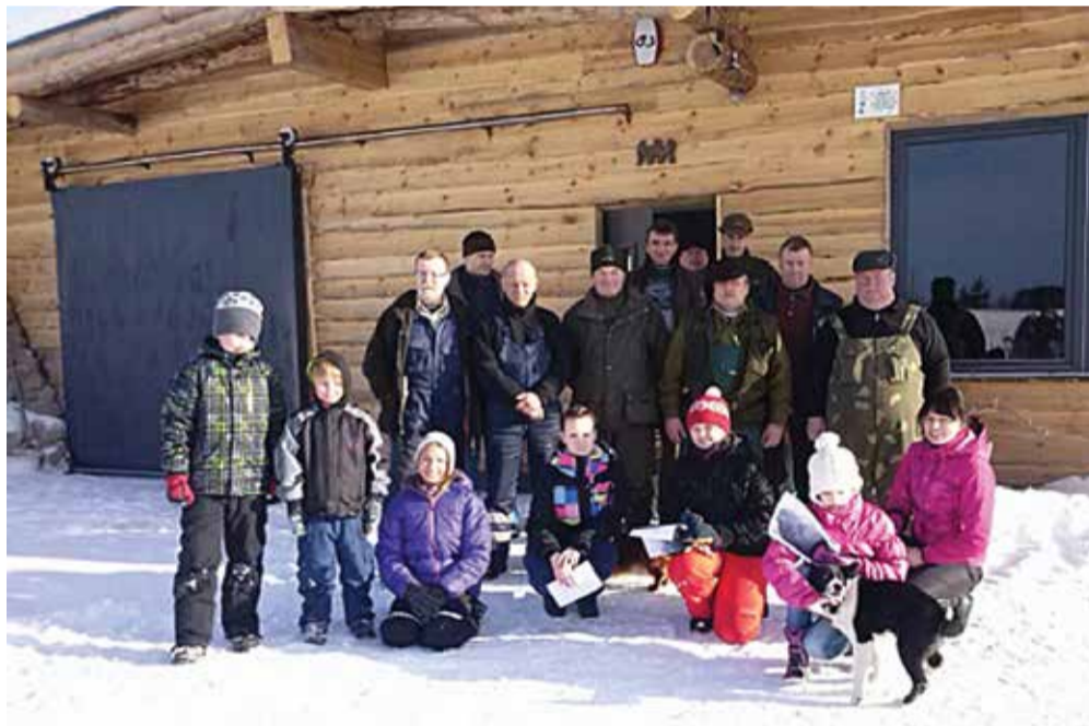
Noored külas Kanepi jahimeestel

Edasi liiguti loomade söögi-kohtadesse, kuhu jahimehed viisid vilja ja kartulit. Noored lisasid kaasavõetud porgandit, kaerahelbeid ning leiba. Kuna lumi oli kohati põlvedeni, siis võeti talverõõmudest, mis veel enne lume sulamist võtta andis - sumbati ja möllati lumes. Kui vähe on õnneks tegelikult vaja! Värske met-