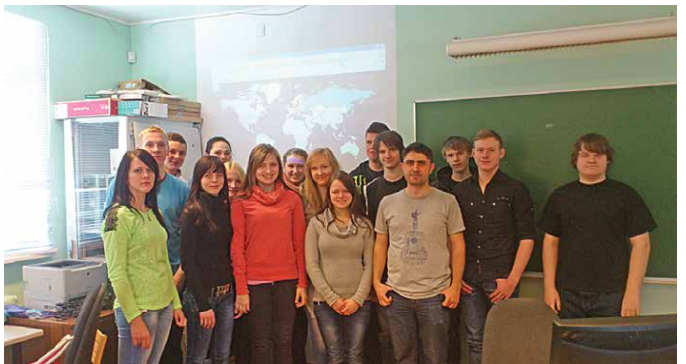
10. klass koos Türgi üliõpilasega pärast arvutitundi