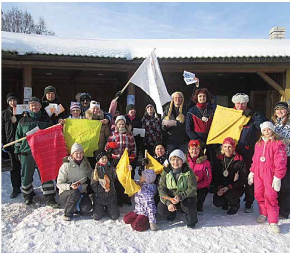
Kanepi valla talispordipäeval osalesid võistkonnad küladest ja valla asutustest.