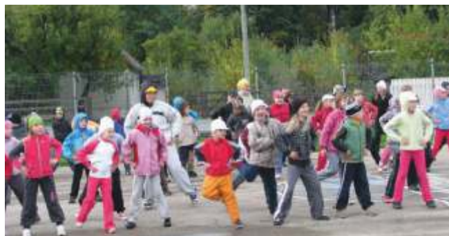
Ülekooliline spordipäev 23. septembril 2011