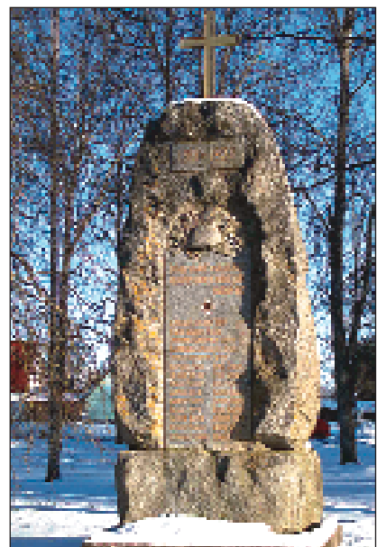
Vabadussõja ausambas Kanepis.

Vastlapäev toimub 23. veebruaril kell 14 Keramäel. (täpsemalt loe lk 4)