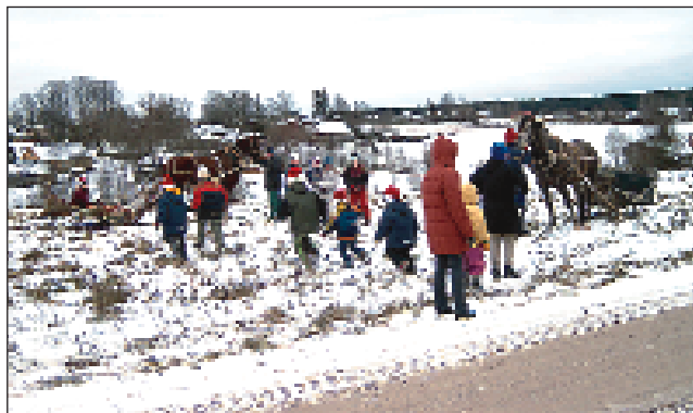
Vastlapäeva juurde kuulub ikka ka saanisõit.

Esimestel aastatel oli tegevus aktiivsem. Tahtsime ju kõike kohe ja korraga saada. Esimene üritus oli tegelikult juba enne seltsi registreerimist: sisustasime ühe advendipühapäeva jõulukuuse all. Hiljem kujunesid välja traditsioonilised üritused. Oleme korraldanud jõululaata (alates detsembrist 2003, siis kahepäevane projekt „Ühiselt ja koduselt Kanepis”, KOPi rahaga korraldatav laat ja perepüha-