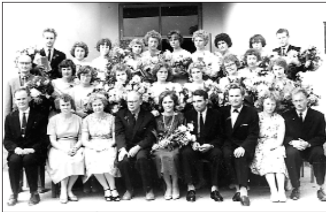
Kanepi keskkooli esimene lend.