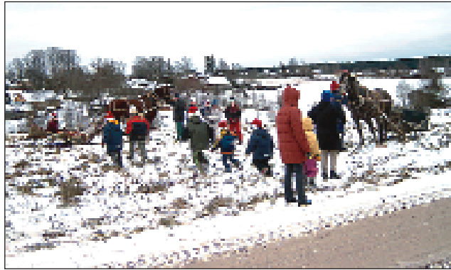
Vastlapäeva juurde kuulub ikka ka saanisõit.

Esimisel aastatel oli tegevus aktiivsem. Tahtsime ju kõike kohe ja korraga saada. Esimene üritus oli tegelikult juba enne seltsi registreerimist: sisustasime ühe advendipühapäeva jõulukuuse all. Hiljem kujunesid välja traditsioonilised üritused. Oleme korraldanud jõululaata (alates detsembrist 2003, siis kahepäevane projekt „Ühiselt ja koduselt Kanepis”, KOPi rahaga korraldatav laad ja perepä-