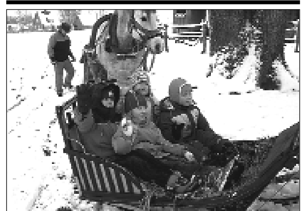
Jõulud Mesipuu talus.