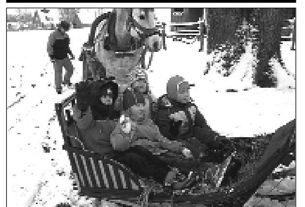
Jõulud Mesipuu talus.