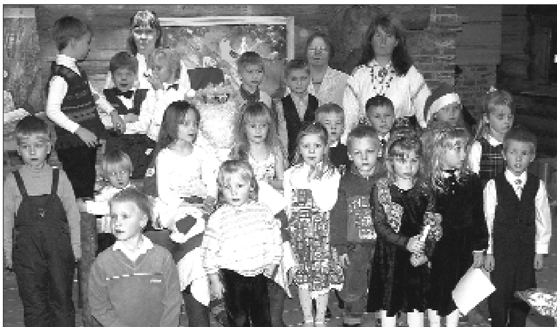
Meenutus jõuludest Pokumaal, kus Kanepi lasteaia vanema rühma lapsi, nende vanemaid ja lasteaiaõpetajaid ootas ees hulk üllatusi: sai ise kingitusi meisterdada, pokulugusid kuulata ja koos Puukoga mängida. Kõige lõpuks tuli ka päris jõuluvana suure kingikotiga. Need jõulud jäävad kindlasti erilist meelde, sest kõik oli nii imeline, alates ainulaadsest Pokukojast ja lõpetades Edgar Valteri loodud kunsti võlumaailmaga.

•Istungi materjalidega saab tutvuda valla raamatukogudes, valla kantseleis ja valla kodulehel www.kanepi.ee (dokumendiregister AMPHORA).