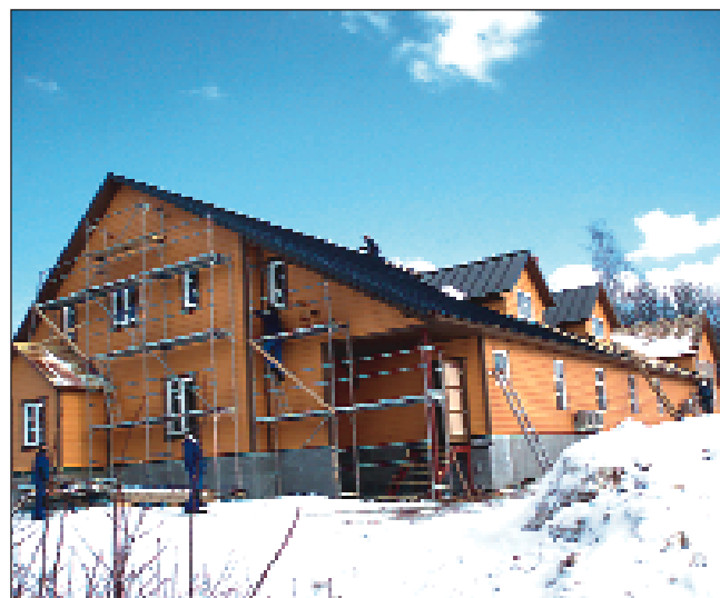
Kanepi seltsimaja ehitustööd jõuavad peatselt lõpule.