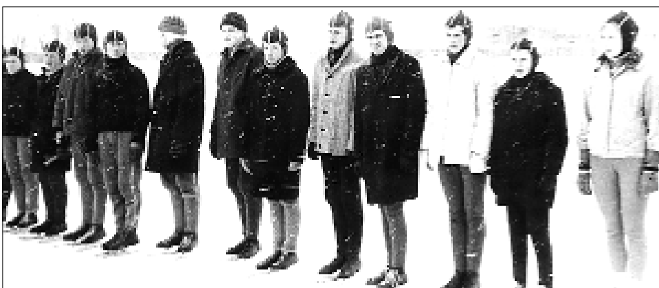
Fotomeenus: Kanepi keskkooli uisutajad.