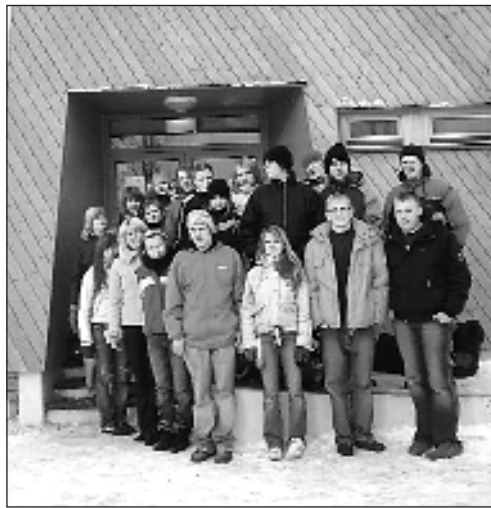
Külas Veriora noortekeskuses.

7. märtsil kell 15.15 toimub noorteaktiivi koosolek „Sinu arvamus loeb”. Oodatud on kõik praegused liikmed ja need, kes tahavad kaasa rääkida, et noortekeskus ikka tõeliselt noorte oma näoga oleks. Tule ja tee ettepanekuid ürituste planeerimiseks ja läbiviimiseks!