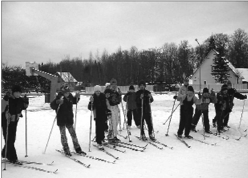
Talve naudivad Kanepi Gümnaasiumi 5. klassi õpilased.