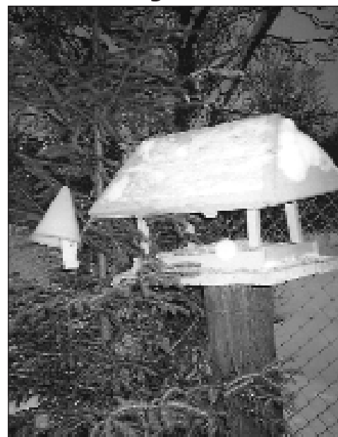
Jõulukuusk lindude teenistuses. Selline on minu kodu akna all olev lindude söögikoht.

Kui ilma juurde tagasi minna, siis olen teinud tänavuse talve kohta ühe tähelepaneku. Nimelt, külm periood ei jää tulemata ja seda ma järeldan sellest, et pole näinud ühtegi kuldnokka ega hoburästast toidumaja juures, kuigi ilmastiik on olnud väga soe. See näitab, et nad on veel oma soojades talvitumispaikades ega lase end meie